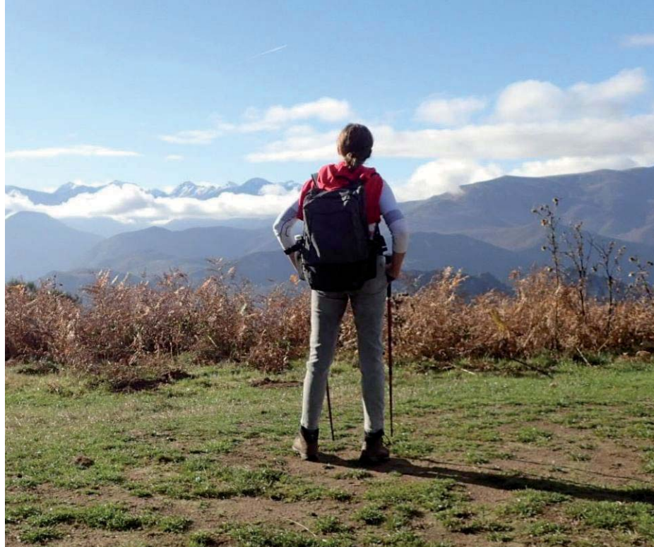
Vue imprenable sur Tarascon